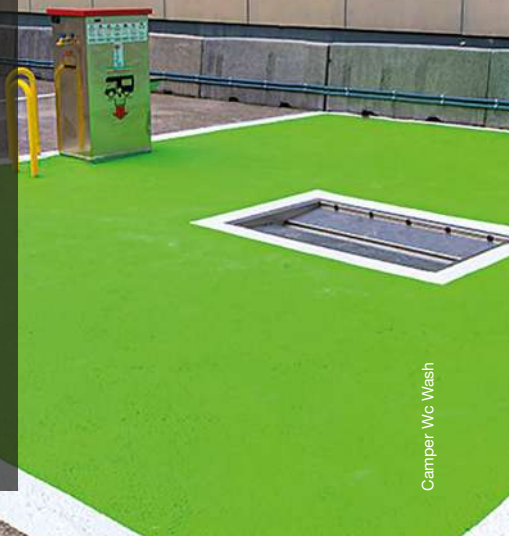
Camper Wc Wash

No viertas las aguas grises en las alcantarillas: sirven para recoger agua de lluvia y suelen acabar en los ríos.